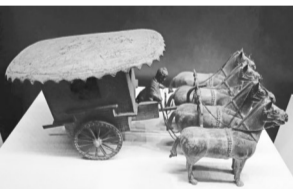
宁夏邮政博物馆馆藏的古代驿车。

《驿使图》壁画砖是反映我国古代邮驿最早的绘画作品。1982年,这幅《驿使图》成为中国邮政的形象大使。从此,策马飞驰的驿使形象深入人心。