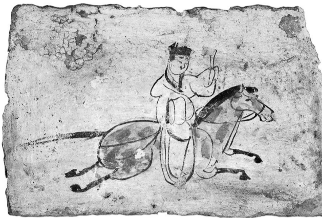
甘肃省博物馆馆藏《驿使图》壁画砖

这块画像砖砖长35厘米,宽17厘米。米色底,黑色轮廓线,寥寥几笔,画师用写实与写意相结合的方式生动准确地摄取了古代驿递过程